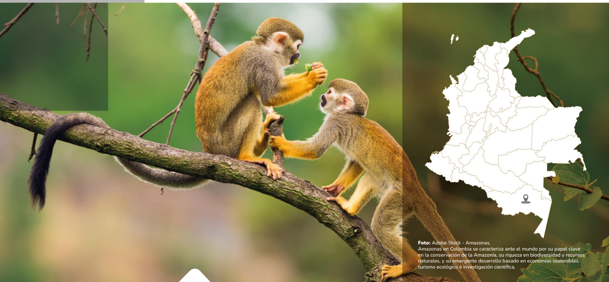
Amazonas. Amazonas en Colombia se caracteriza ante el mundo por su papel clave en la conservación de la Amazonía, su riqueza en biodiversidad y recursos naturales, y su emergente desarrollo basado en economías sostenibles, turismo ecológico e investigación científica.