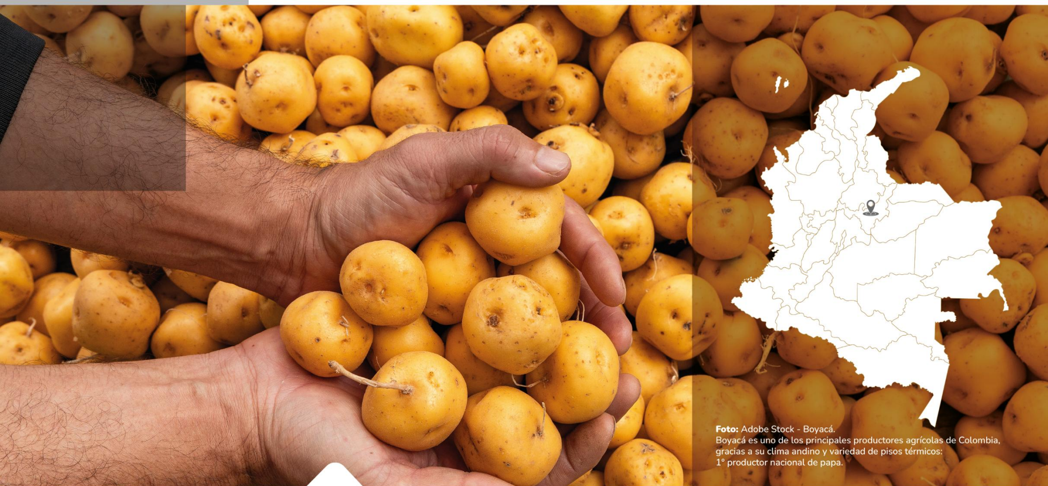
Foto: Adobe Stock - Boyacá. Boyacá es uno de los principales productores agrícolas de Colombia, gracias a su clima andino y variedad de pisos térmicos: 1° productor nacional de papa.